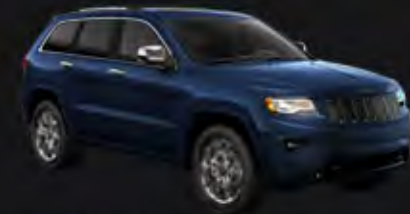
TRUE BLUE PEARL COAT