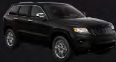
BRILLIANT BLACK CRYSTAL PEARL COAT