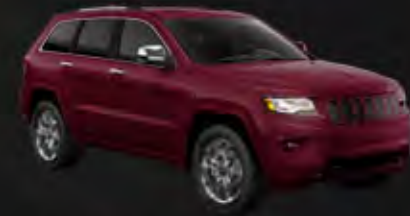
DEEP CHERRY RED CRYSTAL PEARL COAT