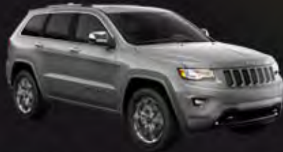
BILLET SILVER METALLIC CLEAR COAT