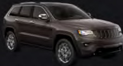
GRANITE CRYSTAL MET. CLEAR COAT