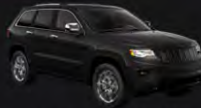
MAXIMUM STEEL MET. CLEAR COAT