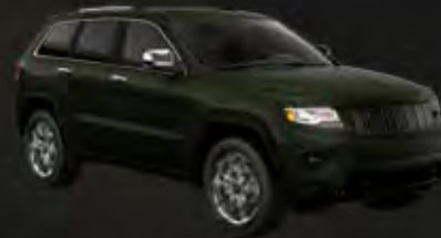
BLACK FOREST GREEN PEARL COAT