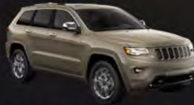
CASHMERE PEARL COAT