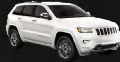
BRIGHT WHITE CLEAR COAT