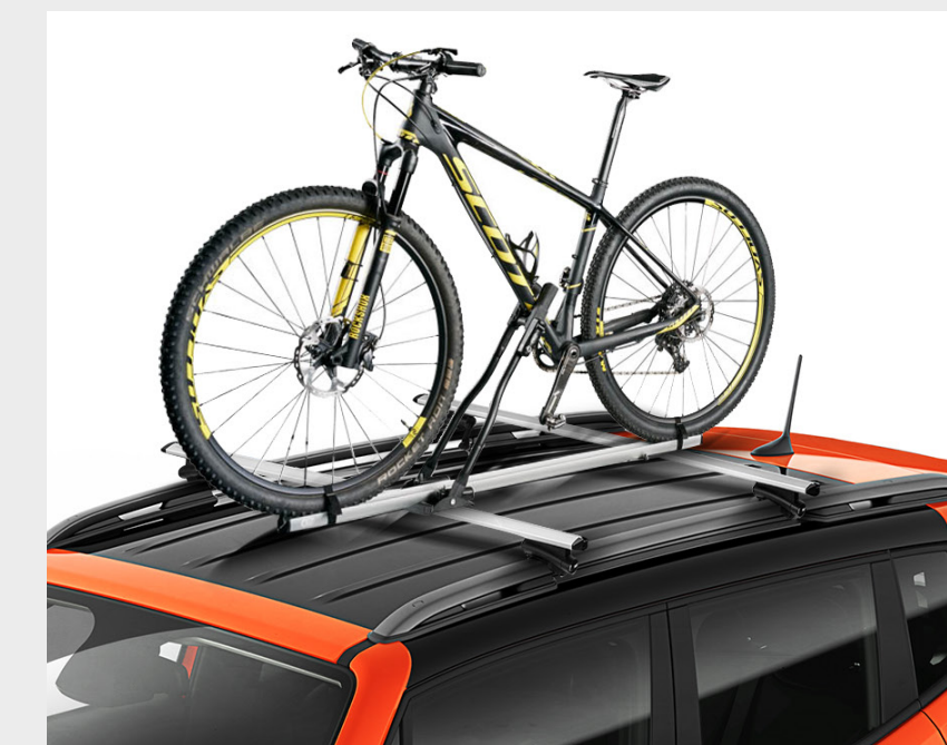
Soporte de bicicleta para techo