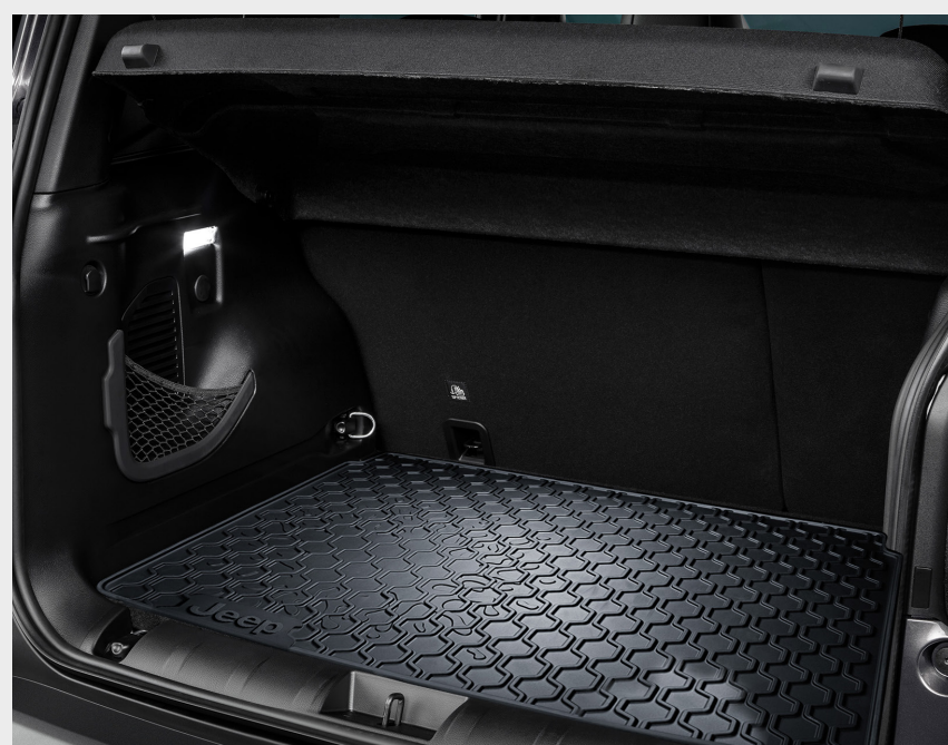
Alfombra baúl Longitude