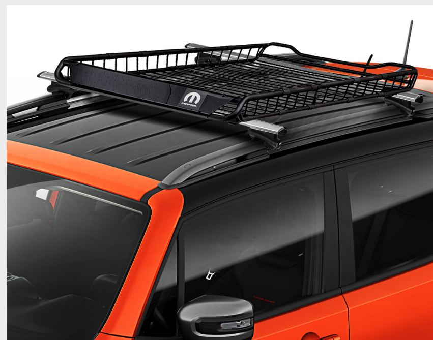
Parrilla portaequipaje MOPAR