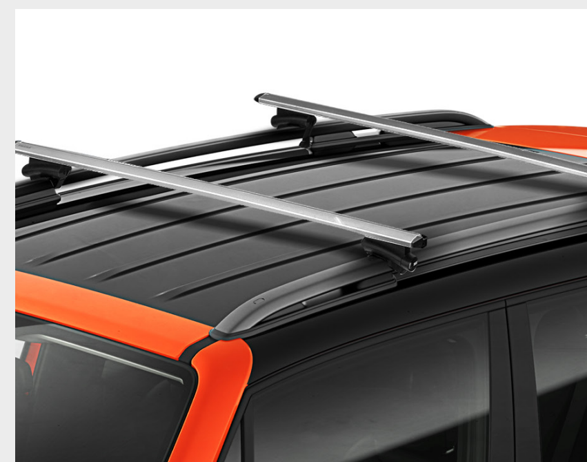
Barra transversal de techo par