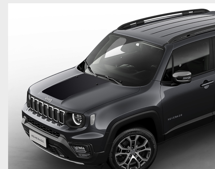
Adhesivo antirreflejo Longitude